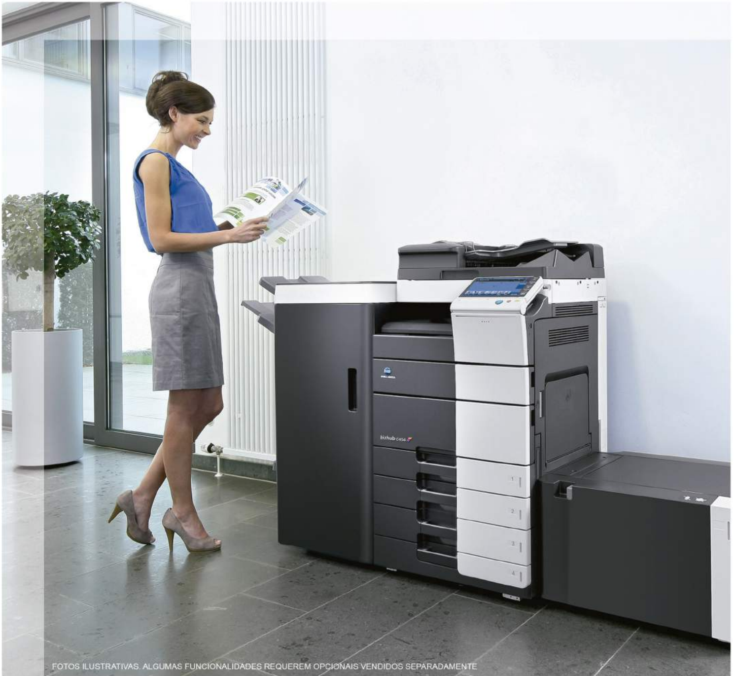
FOTOS ILUSTRATIVAS. ALGUMAS FUNCIONALIDADES REQUEREM OPCIONAIS VENDIDOS SEPARADAMENTE